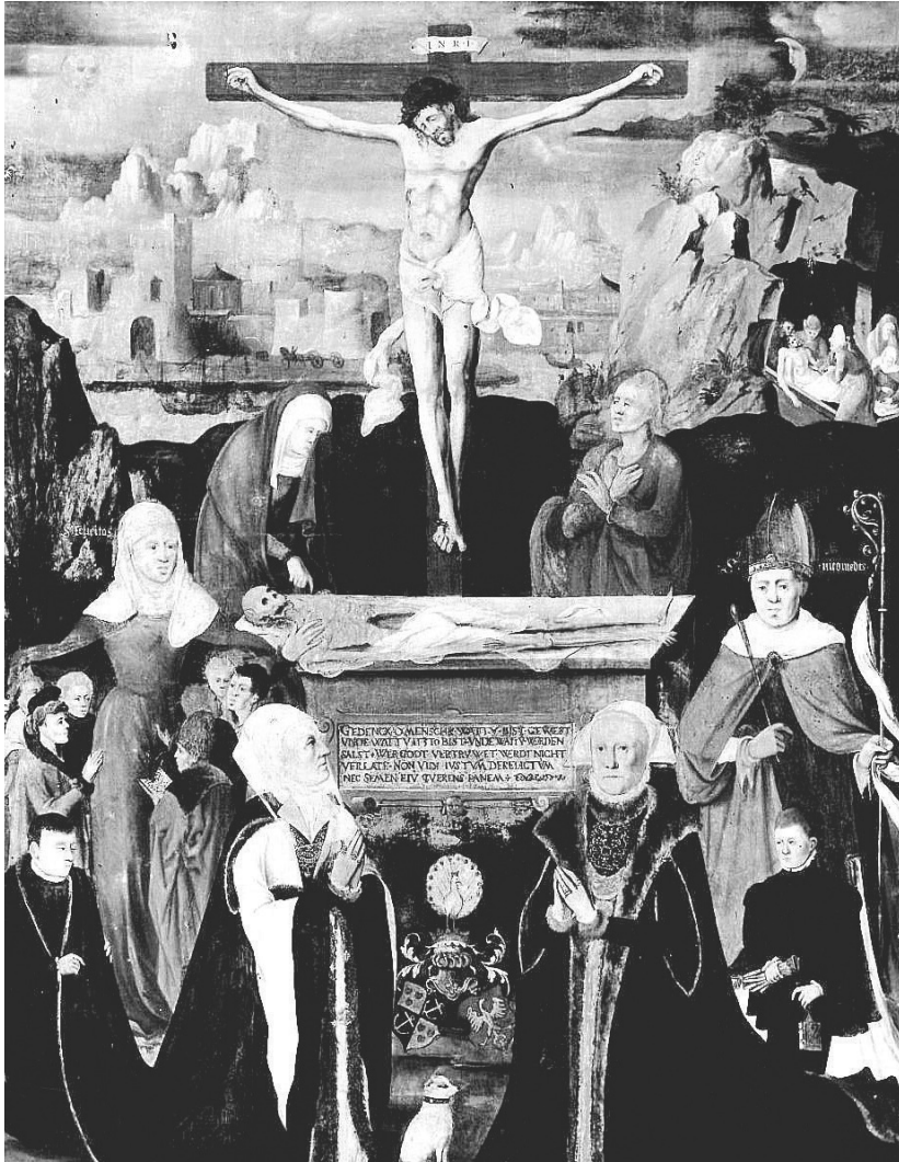
Abb. 2: Jakoba von Tecklenburg, Äbtissin der Stifte Vreden und Borghorst. Gemälde in der Nikolaikirche in Lippstadt.

gehandelt haben, der Smeinck womöglich schon aus dem gemeinsamen Heimatort Rijssen in der Twente kannte.