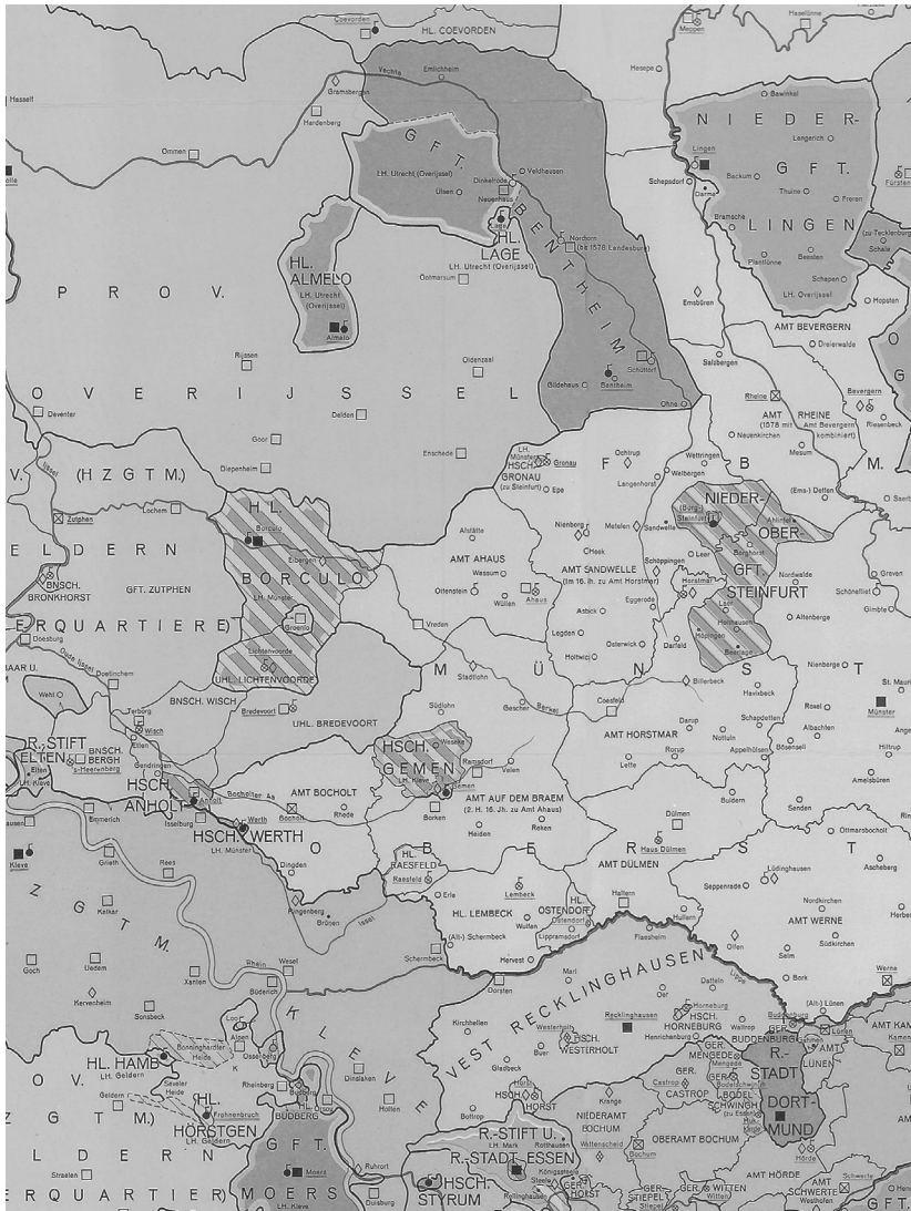
Abb. 1: Die politisch-administrative Gliederung des Westmünsterlandes und seiner Nachbarlandschaften um 1590. (Kartographie: Wolfgang Leesch, Politische und administrative Gliederung um 1590, [Geschichtlicher Handatlas von Westfalen I], Münster 1975, Nr. 2.)