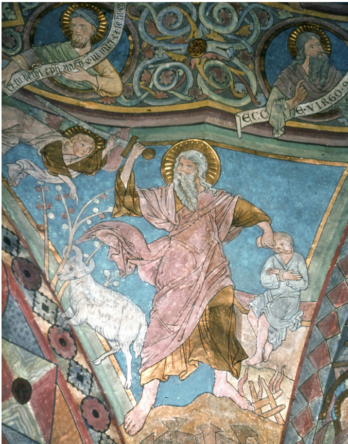
Abb. 4: Die Nordwand im Chorraum.

Und als sie an die Stätte kamen, die ihm Gott gesagt hatte, baute Abraham dort einen Altar und legte das Holz darauf und band seinen Sohn Isaak, legte ihn auf den Altar oben auf das Holz und reckte seine Hand und fasste das Messer, dass er seinen Sohn schlachtete. Da rief ihn der Engel des Herrn und sprach: Abraham, Abraham! Er antwortete. Hier bin ich. [...] Da hob Abraham seine Augen auf und sah einen Widder hinter sich im Gestrüpp mit seinen Hörnern hängen.