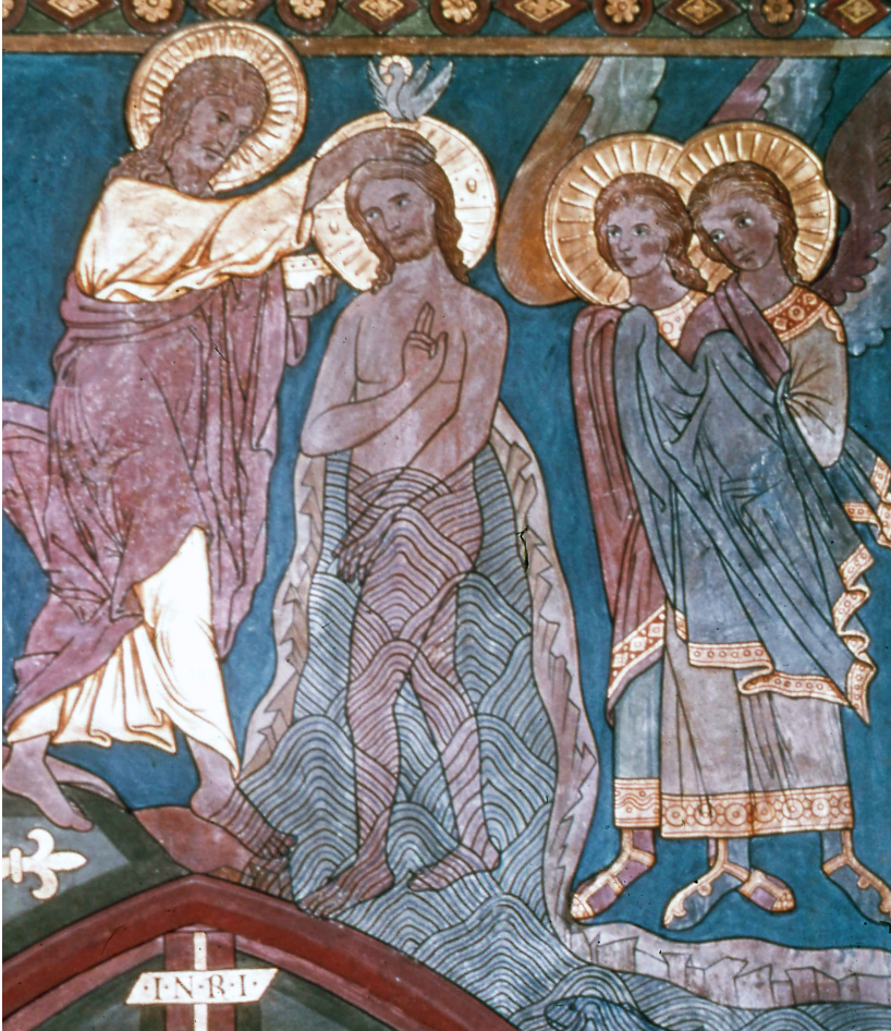
Abb. 9: Die Ostwand im Chorraum.

Und es begab sich zu der Zeit, dass Jesus aus Nazareth in Galiläa kam und ließ sich taufen von Johannes im Jordan. Und alsbald, als er aus dem Wasser stieg, sah er, dass sich der Himmel auftat und der Geist Gottes wie eine Taube herabkam auf ihn. Und da geschah eine Stimme vom Himmel. Du bist mein lieber Sohn, an dir habe ich Wohlgefallen.