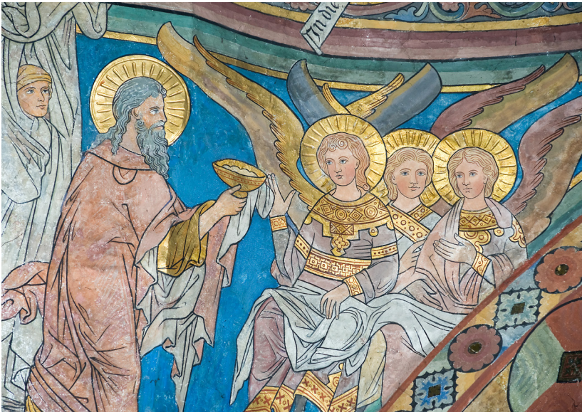
Abb. 3: Die Nordwand im Chorraum.

Und der HERR erschien dem Abraham im Hain Mamre. [...] Und als Abraham seine Augen erhob und sah; siehe, da standen drei Männer vor ihm. [...] Und er sprach zu ihm: Ich will wieder zu dir kommen übers Jahr; siehe, dann soll Sara, deine Frau, einen Sohn haben. Das hörte Sara hinter ihm, hinter der Tür des Zeltes. Und sie waren beide, Abraham und Sara, alt und hochbetagt, sodass es Sara nicht mehr ging nach der Frauen Weise. Darum lachte sie bei sich selbst und sprach: Nun, da ich alt bin, soll ich noch Liebeslust erfahren, und auch mein Herr ist alt.