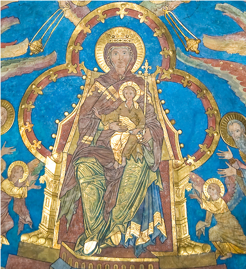
Abb. 15: Das Gewölbe im Chorraum.

Und es erschien ein großes Zeichen im Himmel: eine Frau mit der Sonne bekleidet, und der Mond unter ihren Füßen und auf ihrem Haupt eine Krone von zwölf Sternen. Und sie war schwanger. [...] Und der siebente Engel blies seine Posaune; und es erhoben sich große Stimmen im Himmel die sprachen: Nun gehört die Herrschaft über die Welt unserem Herrn und seinem Christus, und er wird regieren von Ewigkeit zu Ewigkeit.