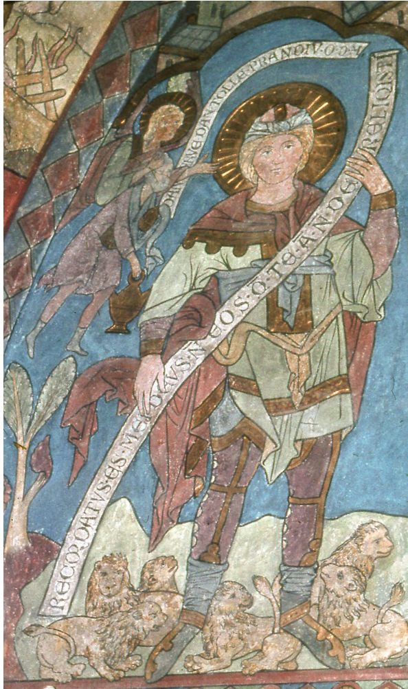
Abb. 8: Die Ostwand im Chorraum.

Daniel aber redete mit dem König: Der König lebe ewig! Mein Gott hat seinen Engel gesandt, der den Löwen den Rachen zugehalten hat, sodass sie mir kein Leid antun konnten; denn vor ihm bin ich unschuldig.