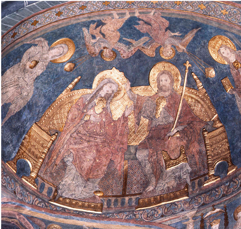
Abb. 16: Das Gewölbe im östlichen Nordschiff.