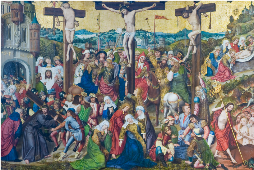
Abb. 11: Der Hochaltar im Chorraum.

Und zur sechsten Stunde kam eine Finsternis über das ganze Land bis zur neunten Stunde. Und zu der neunten Stunde rief Jesus laut: Eli, Eli, lama asabthani? Das heißt übersetzt: Mein Gott, mein Gott, warum hast du mich verlassen? [...] Aber Jesus schrie laut und verschied. [...] Der Hauptmann aber, der dabei stand, ihm gegenüber, und sah, das er so verschied, sprach: Wahrlich, dieser Mensch ist Gottes Sohn gewesen!