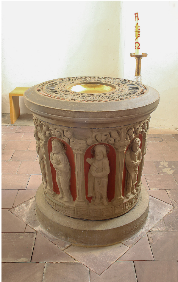
Abb. 13: Die Taufkapelle im Nordwesten.

Und Jesus trat zu seinen Jüngern und sprach: Mir ist gegeben alle Gewalt im Himmel und auf Erden. Darum gehet hin und machet zu Jüngern alle Völker. Taufet sie auf den Namen des Vaters und des Sohnes und des Heiligen Geistes und lehrt sie halten alles, was ich euch befohlen habe. Und siehe: ich bin alle Tage bei euch, bis an der Welt Ende.