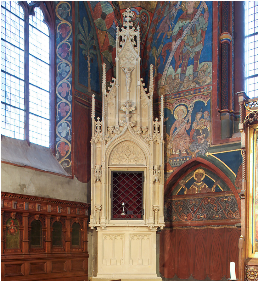
Abb. 10: Das Sakramentshäuschen im Chorraum.

Als sie aber aßen, nahm Jesus das Brot, dankte und brach's und gab's den Jüngern und sprach: Nehmet, esset; das ist mein Leib. Und er nahm den Kelch und dankte, gab ihnen denselben und sprach: Trinket alle daraus, das ist mein Blut des Bundes, das vergossen wird für viele zur Vergebung der Sünden.