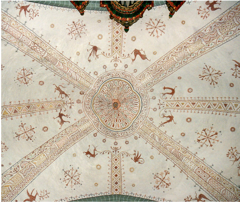
Abb. 1: Das Gewölbe im Kirchenschiff.

Es war zu der Zeit, da Gott der HERR Erde und Himmel machte. Und Gott der HERR pflanzte einen Garten in Eden gegen Osten hin [...] und ließ aufwachsen aus der Erde allerlei Bäume, verlockend anzusehen und gut zu essen, und den Baum des Lebens mitten im Garten und den Baum der Erkenntnis des Guten und des Bösen. Und Gott der HERR machte aus Erde alle die Tiere auf dem Felde und alle die Vögel unter dem Himmel.