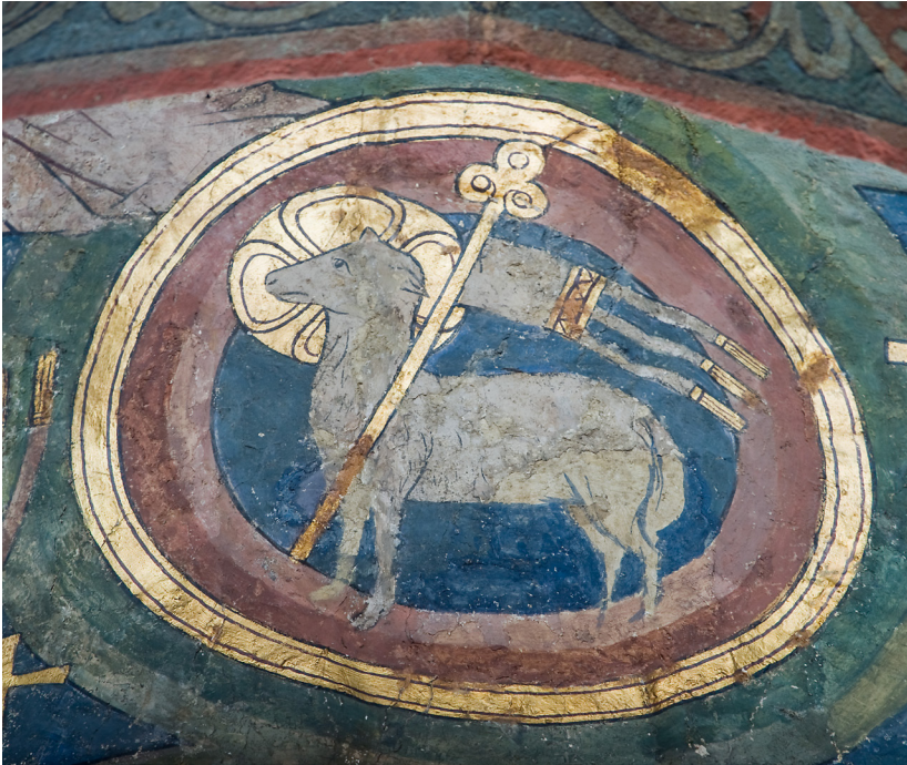
Abb. 14: Die Grabesnische.

Das Lamm, das geschlachtet ist, ist würdig, zu nehmen Kraft und Reichtum und Weisheit und Stärke und Ehre und Preis und Lob.