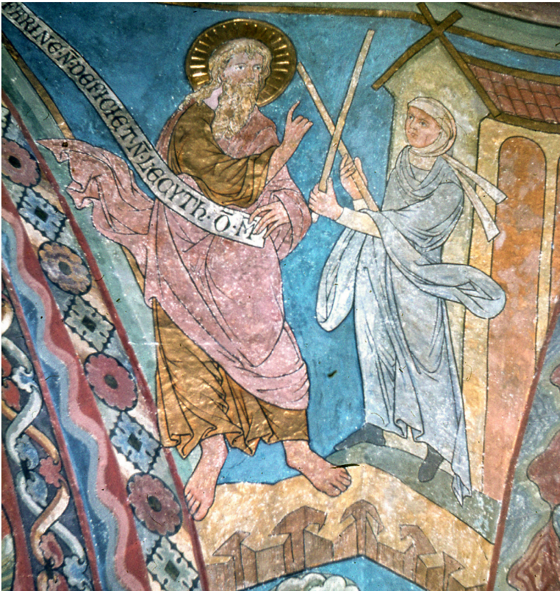
Abb. 7: Die Südwand im Chorraum.

Die Witve sprach zu Elia: Ich habe nichts Gebackenes, nur eine Handvoll Mehl im Topf und ein wenig Öl im Krug. Und siehe, ich habe einen Scheit Holz oder zwei aufgelesen und gehe heim und will's mir und meinem Sohn zubereiten, dass wir essen – und sterben. Elia sprach zu ihr: Fürchte dich nicht. [...] So spricht der HERR, der Gott Israels: Das Mehl im Topf soll nicht verzehrt werden, und dem Ölkrug soll nichts mangeln bis auf den Tag, an dem der HERR regnen lassen wird auf Erden.