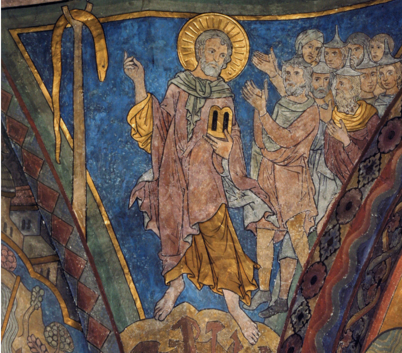
Abb. 5: Die Ostwand im Chorraum.

Da machte Mose eine eherne Schlange in der Wüste und richtete sie hoch auf. Und wenn jemanden eine Schlange biss, so sah er die eherne Schlange an und blieb leben.