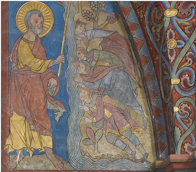
Abb. 6: Die Ostwand im Chorraum.

Und der HERR sprach zu Gideon: Das Volk ist noch zu zahlreich. Führe sie hinab ans Wasser; dort will ich sie dir sichten. Und von wem ich dir sagen werde, dass er mit dir ziehen soll, der soll mit dir ziehen; von wem ich aber sagen werde, dass er nicht mit dir ziehen soll, der soll nicht mitziehen. Und er führte das Volk hinab ans Wasser. Und der HERR sprach zu Gideon: Wer mit seiner Zunge Wasser leckt, wie ein Hund leckt, den stelle besonders; ebenso, wer niederkniet, um zu trinken. Da war die Zahl derer, die geleckt hatten, dreihundert Mann. Alles übrige Volk hatte kniend getrunken aus der Hand zum Mund. Und der HERR sprach zu Gideon: Durch die dreihundert Mann, die geleckt haben, will ich euch erretten und Midian in deine Hände geben; aber alles übrige Volk soll gehen, jeder an seinen Ort.