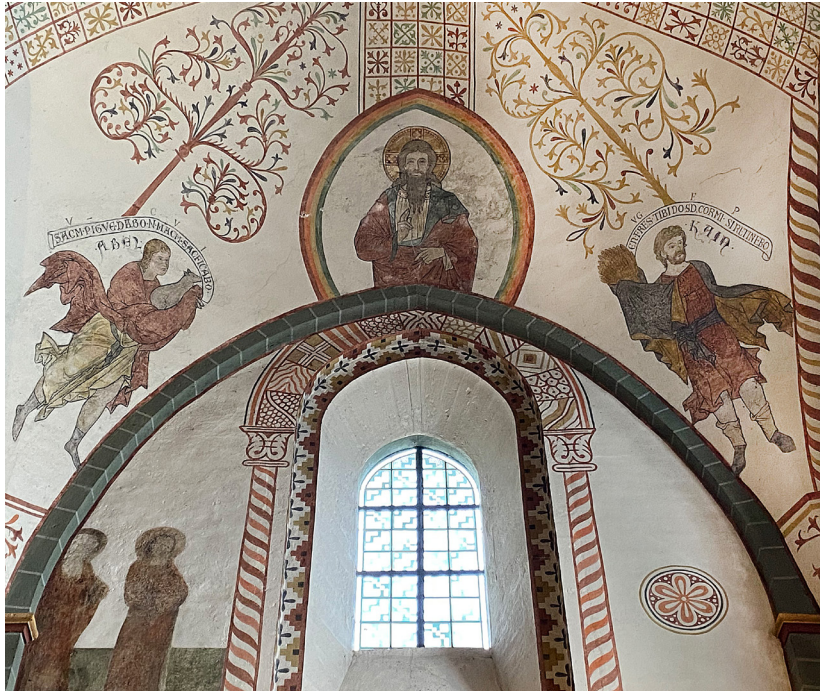
Abb. 2: Das Gewölbe im östlichen Südschiff.

Es gab sich aber nach etlicher Zeit, dass Kain dem HERRN Opfer brachte von den Früchten des Feldes. Und auch Abel brachte von den Erstlingen seiner Herde und von ihrem Fett. Und der HERR sah gnädig an Abel und sein Opfer, aber Kain und sein Opfer sah er nicht gnädig an.