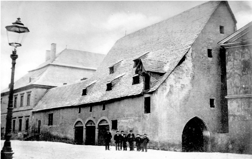
Abb. 3: Mittelalterlicher Rathausflügel, 1877 abgerissen.

Parallel dazu organisierten sich die Bewohner und wurden zu Bürgern. Sie traten von jetzt an nach außen als ein einziger Akteur auf, eben als Stadt Soest. Das ist ein fundamentaler Entwicklungsschritt, in dessen Tradition wir bis heute stehen. Von hier an war Soest geschäftsfähig. Als äußeres Symbol für diese städtische Autonomie präsentierte man in den 1160er Jahren ein eigenes Stadtsiegel – das viertälteste in Deutschland (Abb. 2). 6 Hinzu traten genossenschaftliche Verbindungen, geistliche und fürsorgende Institutionen, Schutzgarantien und die Abgrenzung vom herrschaftlich anders strukturierten Umland. Bis in die 1160er Jahre entwickelte sich das weithin berühmte Stadtrecht. Parallel formierte sich eine Führungselite und bildete Organe und Einrichtungen, die wir bis heute schätzen: Rat (Ersterwähnung 1213), Bürgermeister (Ersterwähnung 1223), Rathaus (Ersterwähnung 1229) ... (Abb. 3). 7 Nicht nur nach außen, sondern auch in seiner inneren Struktur war Soest eine Gemeinde.