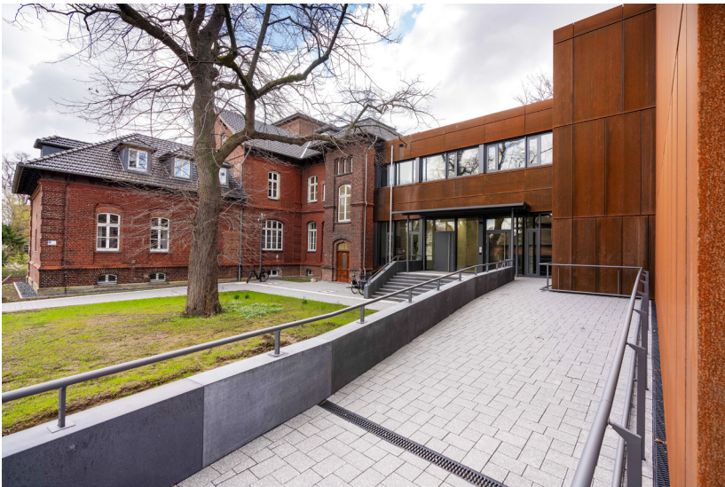
Abb. 11: Der neue Eingangs- und Bürotrakt als Verbindung zwischen dem Denkmal und dem Magazin-Neubau.

gefordert wie die Trennung von öffentlichen und nicht-öffentlichen Bereichen. Zugleich sollten namentlich im öffentlichen Bereich Synergien erzielt und Reserveflächen für mögliche Erweiterungen berücksichtigt werden. 45 Unter den elf Wettbewerbsteilnehmern entschied sich das Preisgericht am 13. Juli 2016 einstimmig für den Entwurf von Banz und Riecks Architekten BDA, Bochum. 46 Danach „stellt der Entwurf einen nachhaltigen Beitrag für ein neues Kreis- und Stadtarchiv dar“. Das Bestandsgebäude wird als Mittelpunkt gewürdigt und der Neubau „harmonisch“ eingefügt. (Abb. 11)