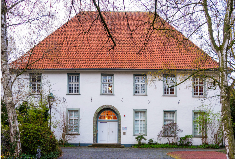
Abb. 9: Das „Haus zum Spiegel“.

auf die ersten Stufen trifft man bereits vor dem Eingang. Das Haus ist viel zu klein; erhebliche Teile der Bestände waren ausgelagert und mussten mühsam und zeitaufwändig herbeigeschafft werden, wenn sie benötigt wurden. Weder die Aufbewahrung noch der Transport in den Lesesaal des „Mutterhauses“ konnten konservatorisch immer nach den Regeln der Kunst gemeistert werden. Das historische Gebäude selbst litt und stöhnte unter der Last, die wir ihm auferlegen mussten, und die anfangs und dann wiederholt nachgelegten statischen Ertüchtigungen haben dem Haus nicht gutgetan. Letztlich nicht vertretbar und schließlich auch entscheidend für die Standortfrage war das Thema Brandschutz – das Knockout-Kriterium für das so mühsam erstrittene Stadtarchiv-Gebäude. 34