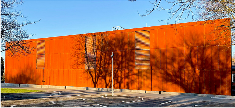
Abb. 12: Neubau des Magazins von Kreisarchiv und Stadtarchiv.

Nach dieser entscheidenden Wegmarke und der anschließenden Beauftragung von Banz und Riecks im November 2016 folgte die – vor allem für den Bauherrn – mühsame Arbeit am Detail. Hier haben die Verantwortlichen des Kreises nicht nur sorgfältig, sondern mit Herzblut gearbeitet. Das heutige Ergebnis ist diesem hohen Engagement zu verdanken. Im Juli 2018 wurde die Baugenehmigung erteilt, am 1. Februar 2019 erfolgte der erste Spatenstich. Im Februar und März 2021 zogen das Stadtarchiv und anschließend das Kreisarchiv in das neue Gebäude ein, und seit Mai standen die Häuser der Nutzung wieder offen, leider aber noch unter den Corona-bedingten Einschränkungen. Groß gefeiert werden konnte erst im Folgejahr, am 11. Juni 2022 „offiziell“ und am 12. Juni mit einem Tag der offenen Tür, der dem Haus und seinen Einrichtungen mehr als 600 Besucherinnen und Besucher bescherte: sicher der stärkste Archivbesuch in den letzten 750 Jahren. Die Neugier auf das neue Archiv war ausgesprochen stark und ist bis heute noch deutlich spürbar.