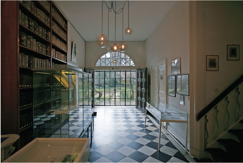
Abb. 10: Eingangsbereich des früheren Stadtarchivs.

In der Folge wurden mancherlei Überlegungen angestellt, etwa zum Hochbunker am Nötten-Brüder-Wall. 35 Bewegung kam in das Thema, als mit dem Kreis Soest ein weiterer Akteur auf den Plan trat. Rückblickend war dies für die heutige Lösung die entscheidende Tatsache! Weil nicht nur die Stadt, sondern auch der Kreis Soest grundlegende Überlegungen zum Standort und Gebäude ihrer Archive anstellte, zumal dessen Magazinkapazitäten erschöpft waren, 36 lag es auf der Hand, hier die Möglichkeiten eines gemeinsamen Vorgehens zu sondieren. Von hier aus gewann der Prozess „Neues Archiv“ an Dynamik und entwickelte auch ein gewisses Eigenleben: Als die jeweiligen Notwendigkeiten und die unmittelbar einleuchtenden Vorzüge eines gemeinsamen Vorgehens erst einmal in der Welt waren, konnte man nicht so einfach wieder hinter diese Urteile und Einsichten zurückfallen. „Zwei Archive unter einem Dach“ – das fand verbreitet Zustimmung. Allerdings waren im gesamten Planungsprozess die Selbständigkeit von Stadtarchiv und Kreisarchiv unumstritten. Ein Fusionsmodell einschließlich einer Umlegung der Kosten, das in Westfalen durchaus verbreitet ist, stand nie ernsthaft zur Debatte.