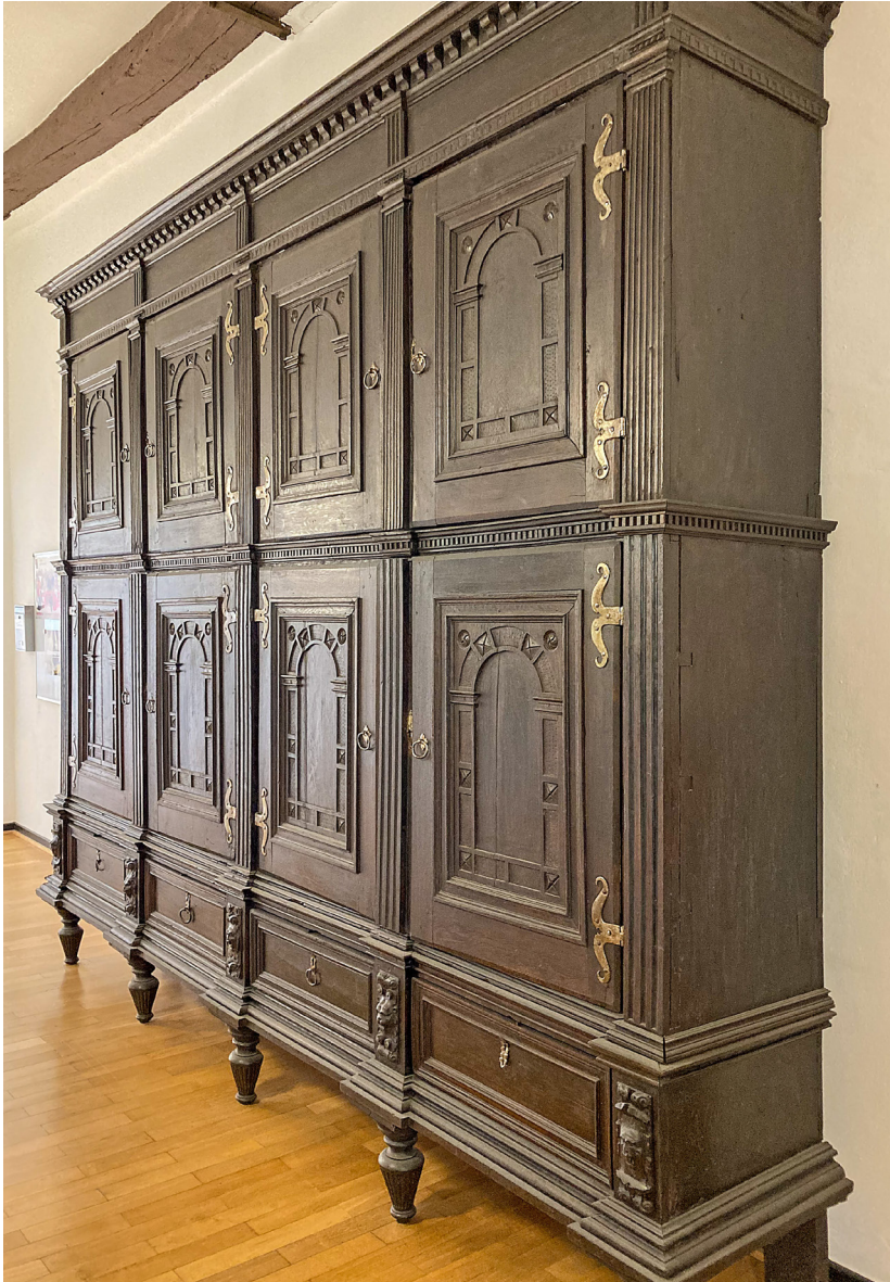
Abb. 4: Archivschrank von 1590.