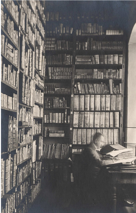
Abb. 8: Hubertus Schwartz im Stadtarchiv Soest 1929.

Die Anzahl von Nutzenden und die daraus resultierenden Erträge der Forschung stiegen kontinuierlich an. Das wäre eine spezielle Untersuchung wert – aber nicht heute. In jedem Fall von herausragender Bedeutung waren die Gründungen des Geschichtsvereins im Jahr 1881 einschließlich der kurz darauf geschaffenen Soester Zeitschrift und des 1904 entstandenen „Verein[s] Heimatpflege“. Von hier aus startete eine Symbiose von institutioneller und ehrenamtlicher lokaler Geschichtsarbeit, die bis heute großartig funktioniert und das Stadt- zu einem wahren Bürgerarchiv macht.