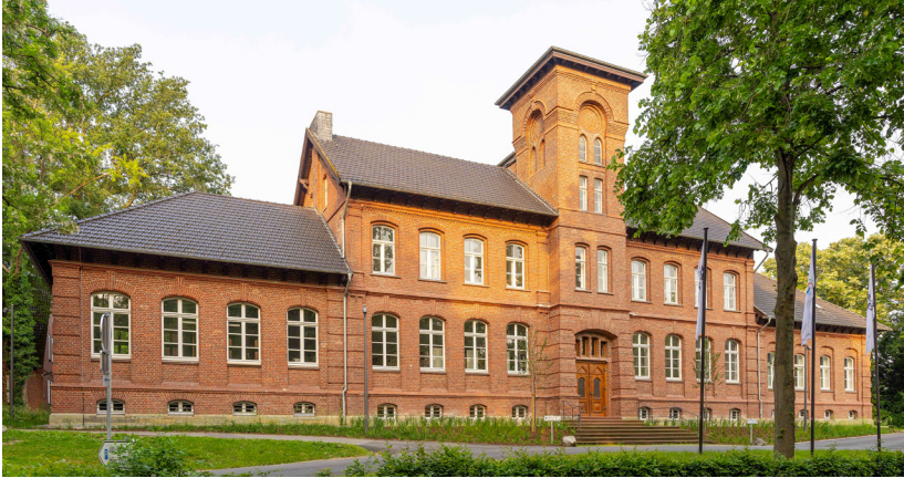
Abb. 1: Denkmalgeschützter Altbau des neuen Archivgebäudes: Die ehemalige Landwirtschaftsschule.

Geburtstag, sondern unser Archiv wurde vor sage und schreibe 750 Jahren erstmals erwähnt. Die Tagung Ihres Vereins greift beides auf – ein uraltes Archiv und zugleich ein nagelneues – und gehört damit hinein in unsere „Festwochen“. Wir freuen uns sehr, dass der Verein für Westfälische Kirchengeschichte seinen 125sten Geburtstag mit uns gemeinsam in Soest feiert.