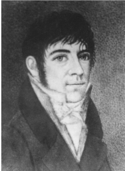
Abb. 7: Kaspar Arnold Geck (1788–1826).

Derselbe Geck wusste auch sehr genau, wie mühsam die Erzeugung solcher Glanzpunkte sein kann, weil man dazu Archive – mit ihren wohlbekannten Unbequemlichkeiten – nutzen muss: „Die Schwierigkeiten, die mit den Nachforschungen in den alten Archiven, mit dem Schöpfen aus den vorhandenen, oft spärlich fließenden Quellen, mit dem Durchlesen der nicht selten verwitterten, in der nicht mehr geläufigen Sprache des Mittelalters, geschriebenen Urkunden verbunden sind, sind nicht gering; wovon sich Jeder, der sich damit, wenn auch nur kurze Zeit, abgegeben hat, bald wird überzeugt haben.“ 26