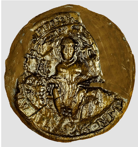
Abb. 2: Das älteste Soester Stadtsiegel (ca. 1160).

Der 20. Mai 1272 als genaues Datum der Ersterwähnung ist Zufall – dass es in Soest schon früh so eine Archiv-Keimzelle gab, ist aber keiner. Im Gegenteil: Eine solche Einrichtung gehörte dazu, wenn sich Siedlungskerne zu bürgerlichen Gemeinden entwickelten. Diesen Prozess der „Kommunebildung“ können wir in Soest seit dem frühen 12. Jahrhundert beobachten. 5 Eine gewaltige Stadtbefestigung, eine Binnengliederung des