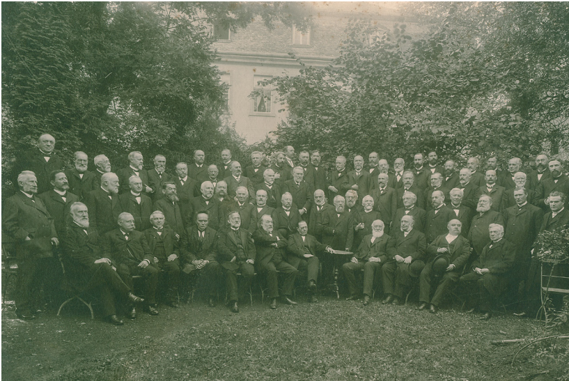
Abb. 1: Westfälische Provinzialsynode in Soest, 1905.

Um Sinn und Funktion eines westfälischen Kirchenarchivs zu erkennen, hilft wie so oft – und gerade damit begründen ja ausgerechnet Archive ihren Daseinszweck – ein Blick auf die eigenen Wurzeln, auf den historischen Auftrag. Diesen erteilte die Westfälische Provinzialsynode im Jahr 1893. Sie tagte im September vor 130 Jahren in der Hohnekirche in Soest.