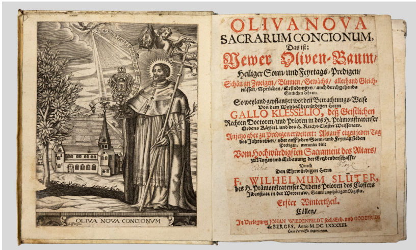
Abb. 3: Wilhelm Schlüter, Oliva nova sacrarum concionum , Wintertheil, Köln 1693.